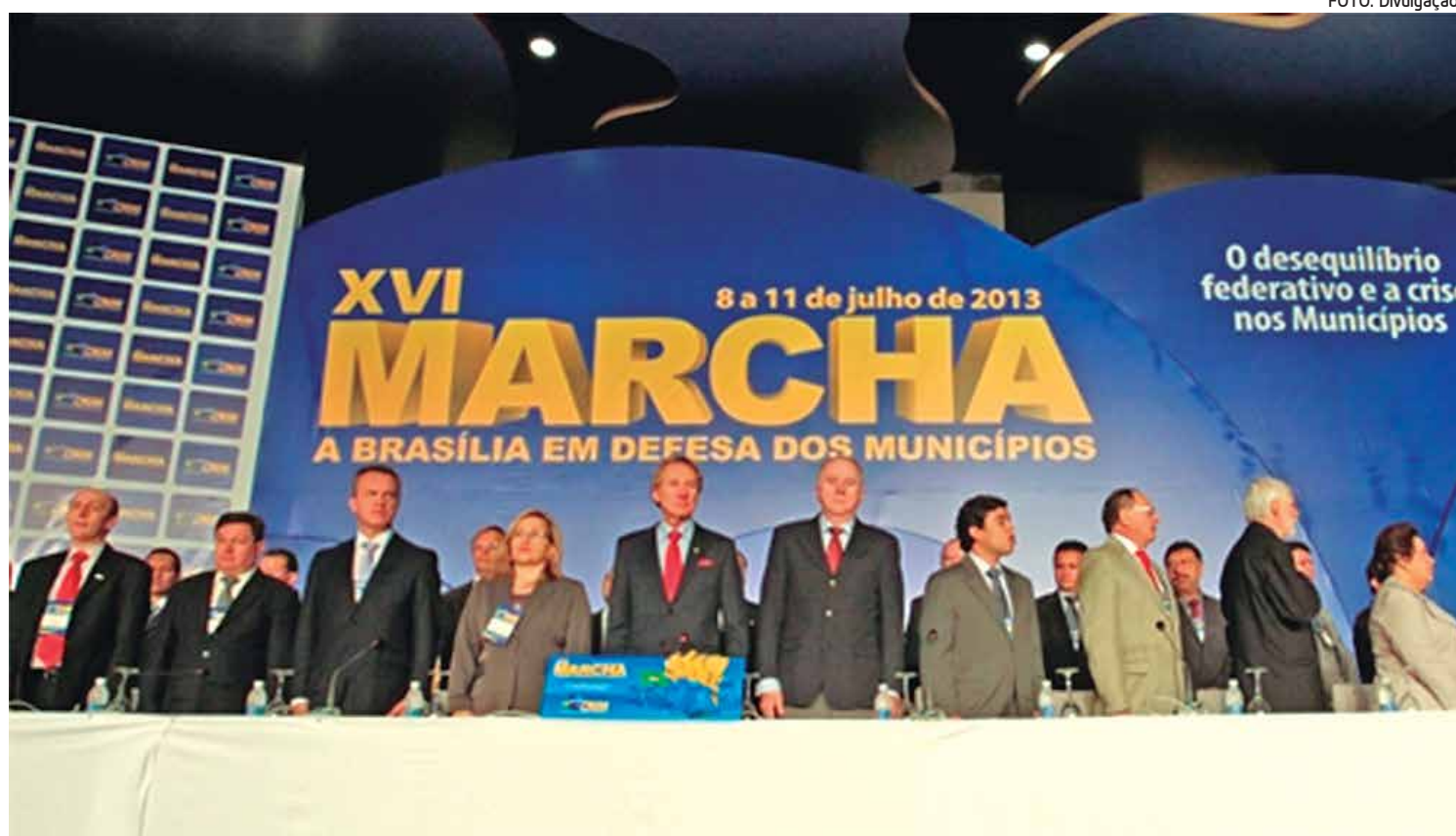
Depois da abertura (foto), esperança dos prefeitos brasileiros se volta agora para a reunião de hoje com a presidente Dilma

Para hoje, está confirmada a presença da presidente Dilma numa reunião com os prefeitos. Pelo que os dois ministros ouviram ontem, o temor da Confederação Nacional dos Municípios é que a presidente não compareça ao evento.