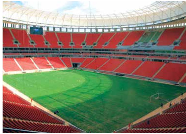
Clubes querem evitar que as torcidas se confrontem em Brasília