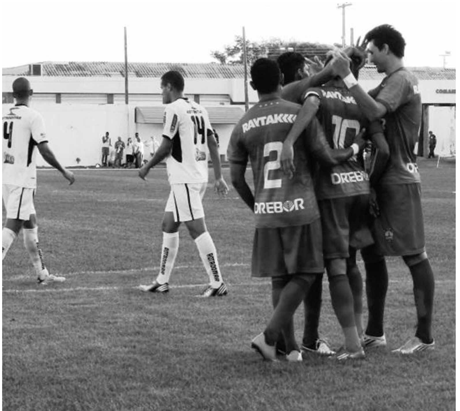
O Galo vem mal na Terceira Divisão, pois estreou perdendo para o Cuiabá, fora de casa, e empatou em 1 a 1 com o Sampaio, no Amigão