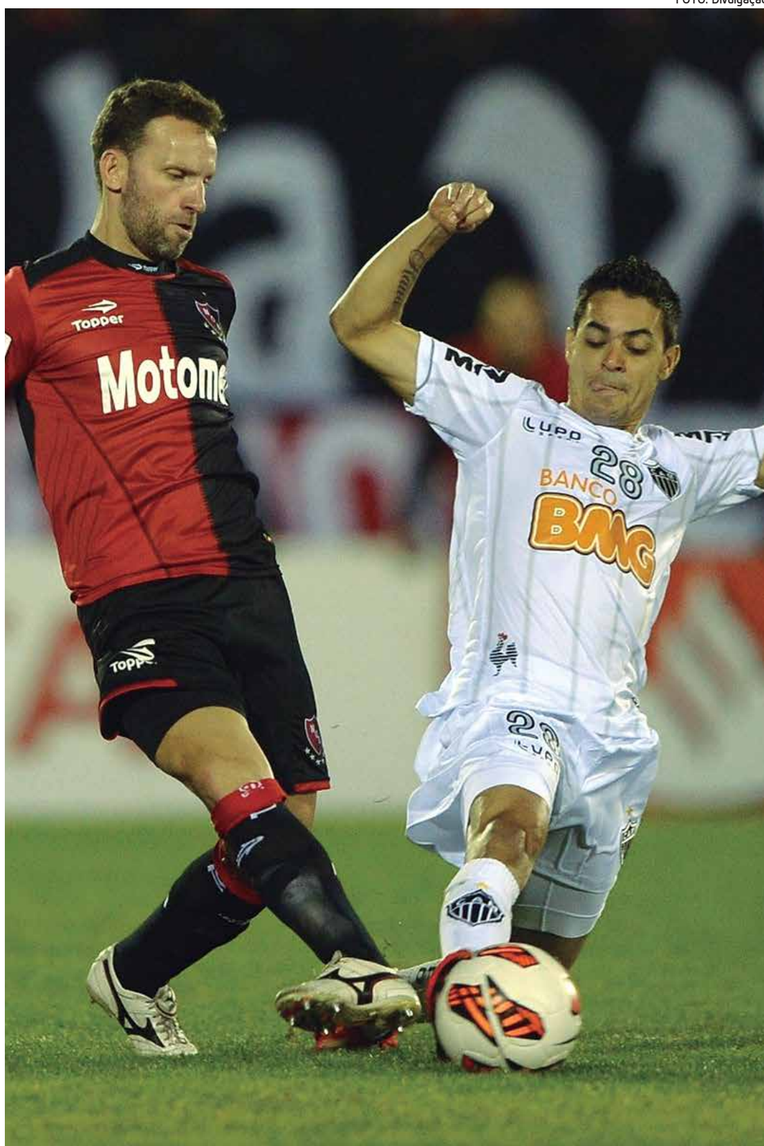
No jogo de ida, em Rosário, na Argentina, o Atlético Mineiro perdeu por dois gols de diferença

O vencedor de Atlético e Newell's enfrentará na final o ganhador de Olimpia e Independiente Santa Fé, que duelaram ontem, às 21h50 (horário de Brasília). O árbitro do jogo será o uruguaio Roberto Silvera, auxiliado por seus compatriotas Miguel A. Nieves e Carlos Pastorino.